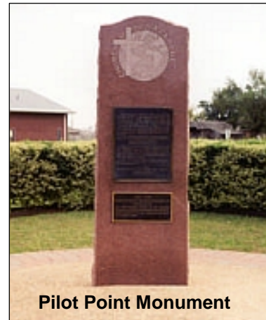
Pilot Point Monument

Eine dieser drei war die Kirche des Nazareners, die in zwölf Jahren schon bis auf 52 Gemeinden gewachsen war. Der Name der neu entstandenen Denomination war Kirche des Nazareners.